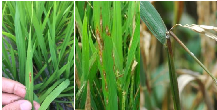
Gambar 1. Gejala Penyakit Blas

Penyakit blas dikenal sebagai penyakit yang cukup penting atau penyakit utama pada tanaman padi, penyebabnya adalah cendawan Pyricularia oryzae . Gejala yang ditimbulkan penyakit ini (Gambar 1) adalah adanya bercak pada daun yang membentuk seperti belah ketupat dengan ujung yang meruncing. Pada bagian tengah bercak berwarna seperti abu-abu yang dikelilinginya berwarna coklat. Hal ini sejalan dengan pendapat Novrika (2009) yang menyebutkan warna bercak diawal gejala berwarna putih atau keabuan yang dikelilingi warna hijau coklat