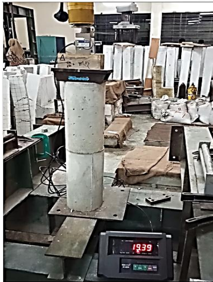
Gambar 2. Uji Kuat Tekan Mortar untuk Menguji Kualitas Ekosemen

Ekosemen dengan campuran abu cangkang bekicot dan abu jerami padi yang dihasilkan selanjutnya akan dibuat beton/mortar dengan campuran pasir dan katalis air dengan perbandingan tertentu (Tabel 5) dicetak dalam cetakan kubus berukuran 25 x 25 x 25 mm. Mortar selanjutnya didiamkan selama 28 hari. Untuk mengetahui kualitas semen yang dihasilkan digunakan uji tekan dengan menggunakan loadcel proving ring dengan kapasitas tekan beban minimal 0,5 Kg di Laboratorium Teknik Sipil, Universitas Brawijaya Malang.