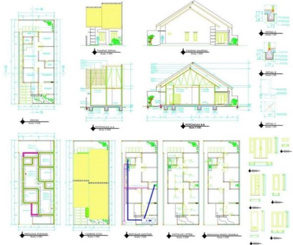
Gambar 2. CONTOH PRODUK DESAIN RUMAH I