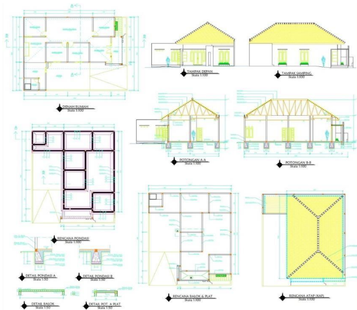
Gambar 3. CONTOH PRODUK DESAIN RUMAH II