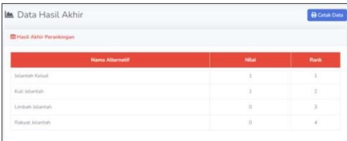
Gambar 3 Tampilan Hasil Akhir Perangkingan

Berdasarkan hasil sistem yang dibuat diperoleh hasil akhir seperti pada gambar 3.