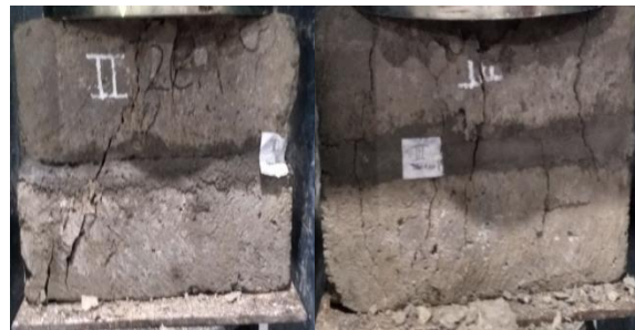
Gambar 3. Pola kerusakan

Pengujian yang dilakukan pada pasangan batako yaitu kuat tekan memakai mortar yang campurannya 1pc:4ps menggunakan variasi ketebalan 0,5cm, 1cm, dan 2cm disimpulkan memiliki pola kerusakan yang sama pada semua variasi. Gambar 3 dibawah ini merupakan gambaran pola kerusakan yang terjadi pada benda uji.