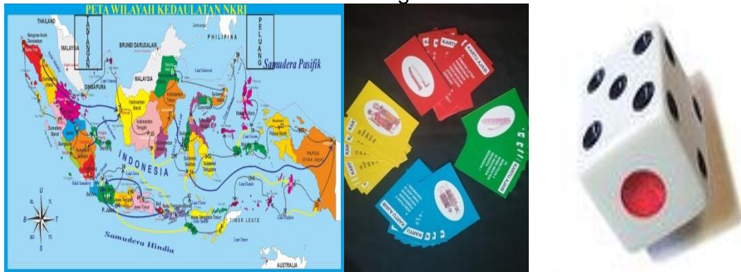
Gambar.4.2. Desain Produk

dapat overlap sesuai dengan arah yang dituju namun apabila tidak dapat menyelesaikan dengan benar maka ia berhenti di kota tersebut. Kartu tantangan dan peluang ini terdiri dari dua sisi. Sisi atas berisi dengan gambar-gambar yang mencerminkan kebudayaan atau identitas suku bangsa Indonesia, sementara sisi yang satu berisi tentang pertanyaan seputar wawasan nusantara dan wawasan kebangsaan.