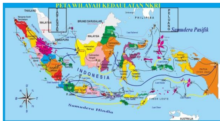
Gambar.4.1. Platform Game.

Desain platform game ini didesain dengan menggunakan aplikasi pengolah gambar. Langkah pertama membuat peta Indonesia versi terbaru dengan jumlah 34 provinsi yang kemudian dilengkapi titik-titik dan jalur rute (garis putus-putus) yang harus dilalui oleh pemain. Arah panah ada dua warna. Biru untuk langkah maju dan kuning untuk langkah mundur.