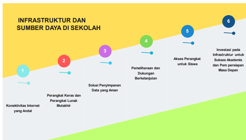
GAMBAR 2. PENTINGNYA INFRASTRUKTUR DAN SUMBER DAYA YANG MEMADAI DALAM Mendukung Integrasi Teknologi yang Efektif di Lingkungan Sekolah Menengah Pertama

Temuan penelitian ini menunjukkan bahwa infrastruktur dan sumber daya yang memadai sangat penting untuk integrasi teknologi yang efektif dalam kepemimpinan sekolah menengah pertama. Infrastruktur ini harus mencakup konektivitas internet yang andal, perangkat keras dan perangkat lunak yang mutakhir, solusi penyimpanan data yang aman, serta layanan pemeliharaan dan dukungan yang berkelanjutan. Kepala sekolah juga harus memastikan bahwa siswa memiliki akses ke perangkat seperti laptop atau tablet selama jam pelajaran, karena hal ini dapat membantu mereka menyelesaikan tugas dengan lebih efisien dan efektif [45], [46], [47]. Dengan berinvestasi pada infrastruktur dan sumber daya yang memadai untuk integrasi teknologi, kepala sekolah dapat memastikan bahwa siswa memiliki akses ke perangkat yang mereka butuhkan untuk sukses secara akademis sambil mempersiapkan mereka untuk sukses di perguruan tinggi atau karier setelah lulus dari program sekolah menengah pertama. Temuan penelitian ini menunjukkan bahwa integrasi teknologi yang efektif dalam kepemimpinan sekolah menengah pertama melibatkan kombinasi strategi yang menangani berbagai aspek operasional sekolah.