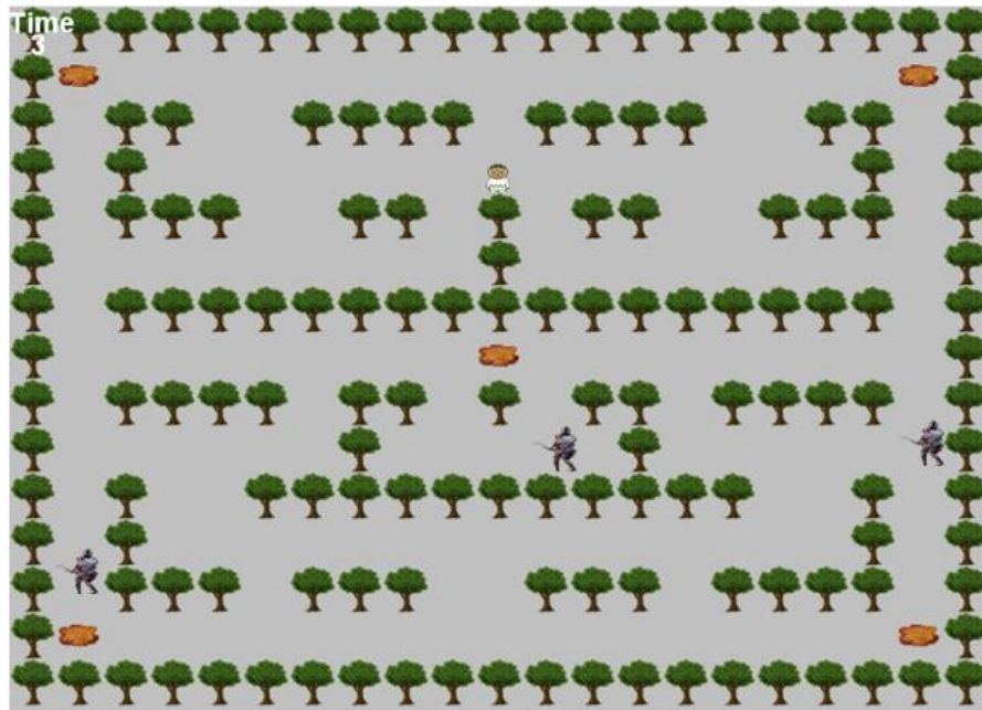
Gambar 2. Antarmuka Pengguna Ghost Traditional Game dengan Level Mudah

Berikut adalah antarmuka pengguna dari Ghost Traditional Game dapat dilihat pada Gambar 2 dan Gambar 3. Kemudian untuk contoh pengkodean AI dapat dilihat pada Gambar 4.