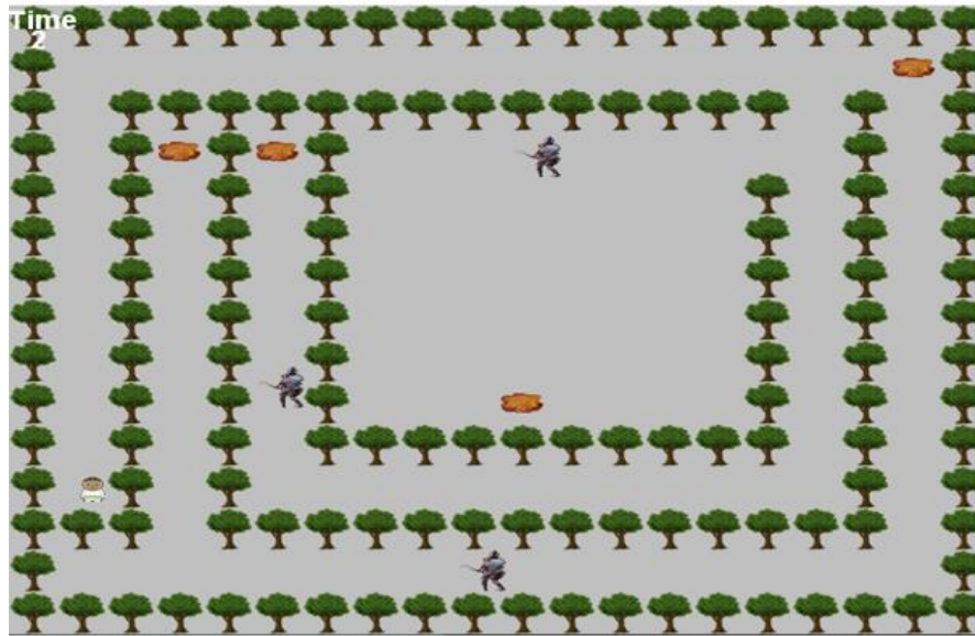
Gambar 3. Antarmuka Pengguna Ghost Traditional Game dengan Level Sulit

Berdasarkan Gambar 3, merupakan salah satu contoh jenis level dengan kategori sulit, di mana desain peta yang cenderung tertutup, banyak penghalang, dan sangat menyulitkan player untuk menuju gift . Jumlah musuh sedikit dengan posisi yang menutupi akses menuju gift .