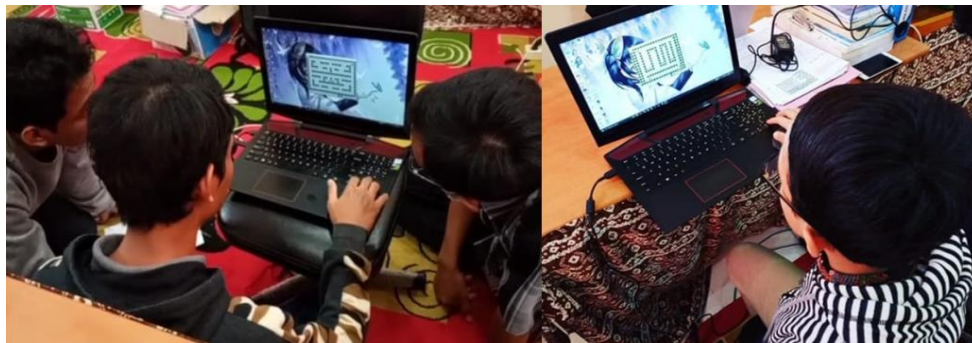
Gambar 5. Proses Game Testing kepada Beberapa Player

Pola pada game design dirancang untuk menjaga motivasi player dan juga memprediksi jumlah iterasi ketika gagal dalam menyelesaikan misi pada masing-masing level . Alur yang dirancang dari Level 1 sampai dengan Level 2 secara acak mengkategorikan level mudah dan sulit (Lihat Tabel 2), hal ini akan diuji coba pada tahap game testing untuk memastikan sejauh mana pola pada game design ini terpenuhi. Pada kolom prediksi jumlah iterasi, merupakan tingkat perulangan yang telah diprediksi ketika player menyelesaikan sebuah misi dari masing-masing level game .