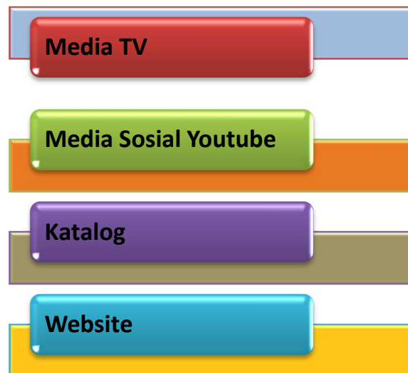
Gambar 3. Urutan Pilihan Responden

Keterbatasan waktu dalam penayangan iklan membuat konsumen kurang puas dengan informasi yang diberikan. Kemungkinan media TV dalam menampilkan iklan kurang terperinci. Selanjutnya konsumen mencari informasi